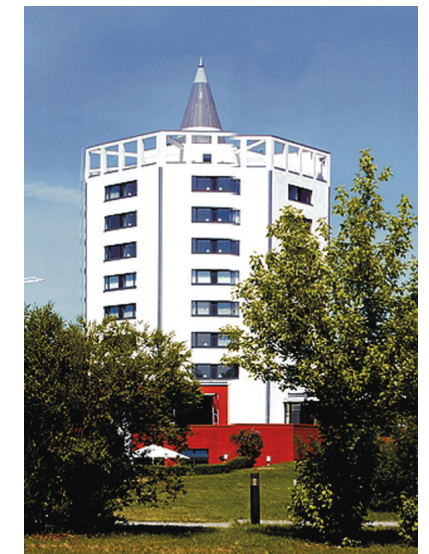
Bildungszentrum Erkner bei Berlin

in Kooperation mit der Deutschen Rentenversicherung Bund